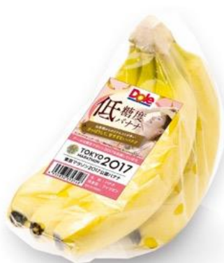
＜「低糖度バナナ」商品画像＞