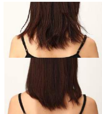
上) 使用前イメージ画像 下) 使用後イメージ画像