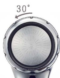
カートリッジの交換は フタを回すだけで簡単