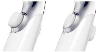
手元の一瞬止水ボタンでお湯の ON/OFFをワンタッチ操作可能