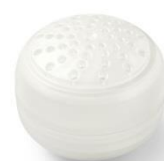
残留塩素の除去が可能 約1ヶ月使用できる交換式カートリッジ