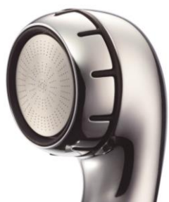
0.3mm径の穴が296個空いた散水板による 細やかで柔らかなシャワー