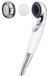
水道水に含まれる残留塩素の除去が可能な 交換式カートリッジ

三菱レイヨン株式会社(本社:東京都千代田区、社長:越智仁)のグループ会社である、浄水器、医療用水処理装置の販売を行う三菱レイヨン・クリンスイ株式会社(本社:東京都品川区、社長:池田宏樹 以下、当社は、美容市場向けブランド「WATERCOUTURE(ウォータークチュール)」より、一般家庭・施設向けの浄水シャワーヘッド《WS301》を4月より新発売します。