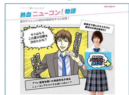
『熱血ニューコン！物語』画面

チャレンジしたい、がんばりたいことのためにコンタクトレンズデビューを考えはじめることも多い中高生に向けて、コンタクトレンズの基礎知識などについて紹介するデジタルコミック。初めてのコンタクトレンズで分からないことや不安なこと、気をつけたいことなどを、コミック形式で楽しみながら学び、解消するサポートをいたします。