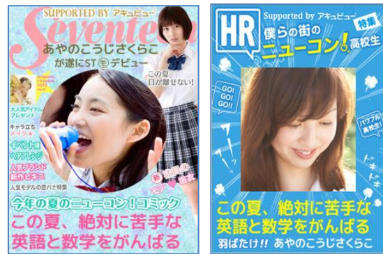
Seventeen、HR 風のオリジナル表紙