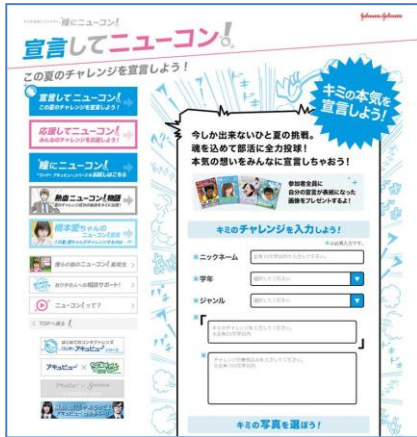
『宣言してニューコン』画面

また、『応援してニューコン！』では、投稿された「ニューコン宣言」の中から、共感したものに“ニューコンボタン”を押して応援することができます。