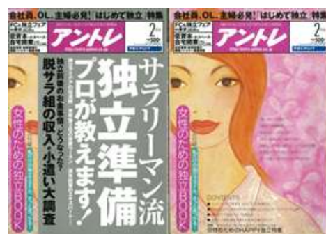
■ アントレ 女性の独立特集