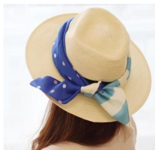
ハンカチーフアレンジのイメージ