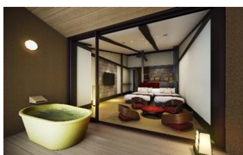
露天風呂付最上階客室