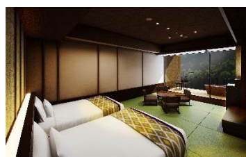
露天風呂付客室（溪谷側）