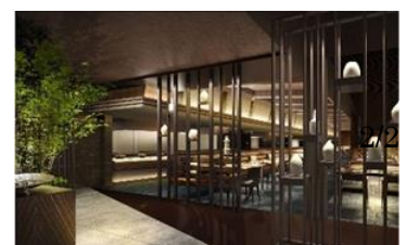
ダイニングはこね