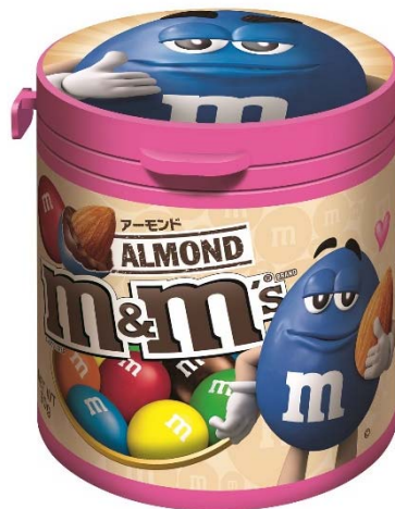
「M&M'S® ボトル アーモンド」