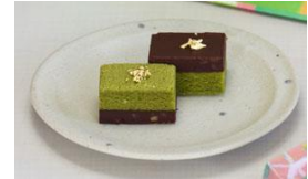
はなことたろう (5個入り 税抜 880円)

和菓子屋としてのこだわりを持ちながらも、伝統的な和菓子の素材にとらわれない試みを続け、菓子の新しい楽しみ方を提案。素材の可能性の広がりを感じていただけるブランドです。