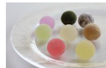
ゆうたま(7個 税抜 880円) 和三玉(7個 税抜 1,100円)

四国の、そして日本のよいものをお菓子に。北川柚子・有機すだち・阿波山桃・幻の果実“ゆこう”。四国産の素材で仕立てた、こだわりあるお菓子を提案するブランドです。