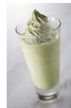
辻利・抹茶ホワイトチョコ (税抜 500円)