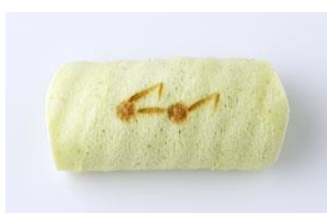
<茶菓工房たろう> ちよこっと食べてミント（税抜 200 円）

1周年を記念して、各ブランドが「えんなり」のために特別に開発した限定商品をご用意！ 4月4日（火）より販売開始。