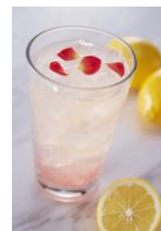
ローズマイヤーレモネード (税抜 480円)

レモンとオレンジを掛け合わせて作られたカリフォルニアではメジャーなマイヤーレモン。ローズの香りと花びらを加えた見た目も春らしいレモネード(写真左)が登場。デザートドリンクでは香り高い、京都・辻利の抹茶を使用した辻利抹茶ホワイトチョコ(写真右)が登場。