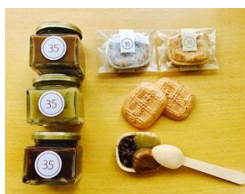
<菓心 おおすが> 和のコンフィチュール（税抜 2,500 円）