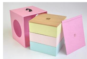
<菓游 茜庵> 春の遊山箱（税抜 5,290 円）