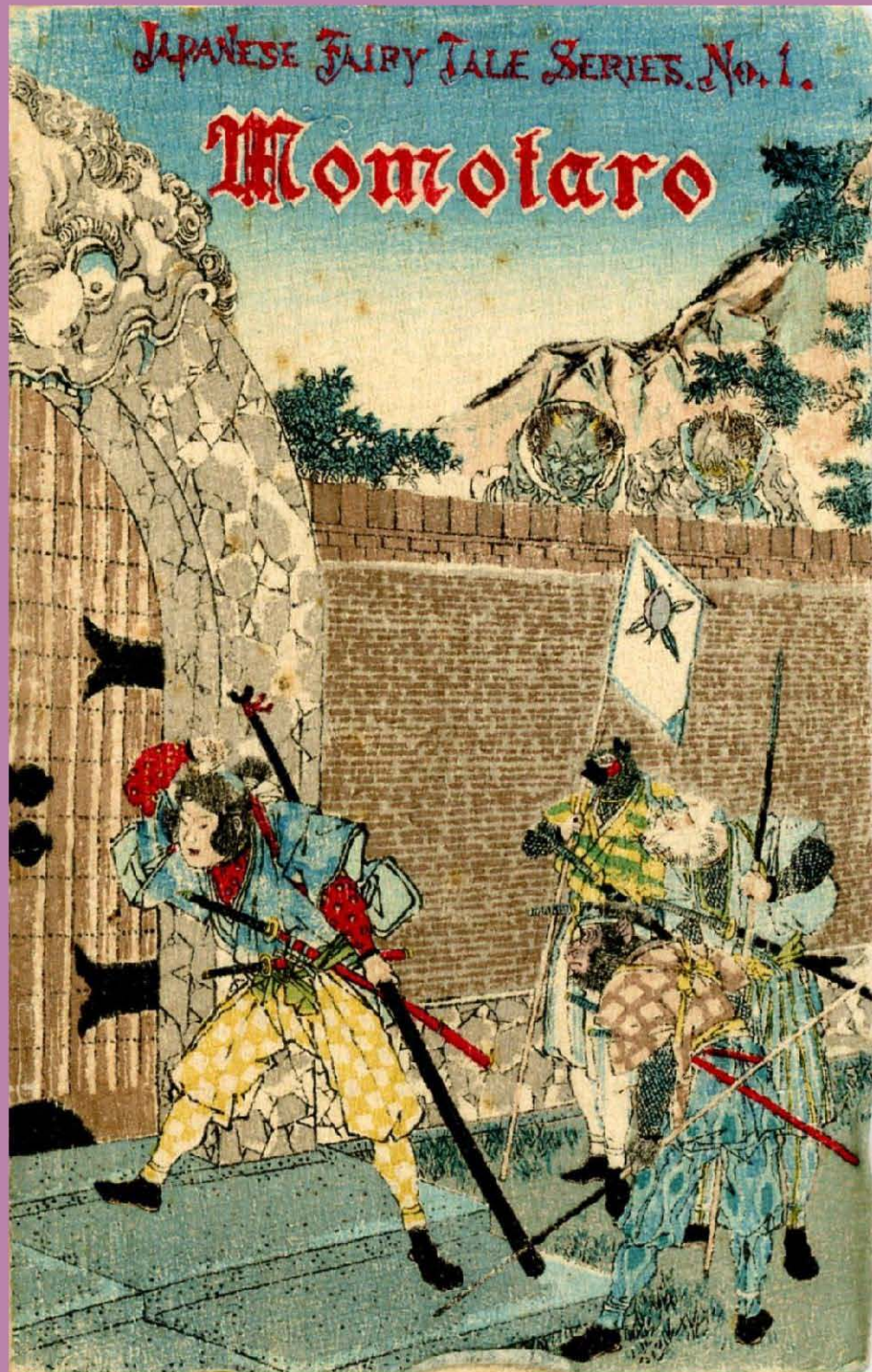
『桃太郎』英語版(初版) 1885(明治18)年発行