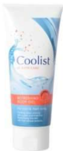
リフレッシュ&クールボディジェル

◆「Coolist リフレッシュ&クールボディジェル」ECサイト： https://nonplex.jp/item/2256