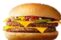
ダブルチーズバーガー