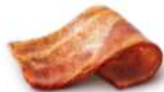
スモークベーコン

もちもち食感が味わえるオリジナルのマフィンに、ぷるぷる食感がたまらない国産の卵とジューシー＆スパイシーなソーセージパティ、チェダーチーズを入れた朝の人気メニュー「ソーセージエッグマフィン」に、香ばしい味わいでジューシーなスモークベーコンをプラスした「裏ソーセージエッグマフィン」が登場。その絶妙なハーモニーがアクティブな一日のスタートにぴったり一品です。