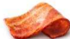
スモークベーコン

ジューシーなポークパティを日本ならではの「てりやき」風味に仕上げた、食べ応えとコクのある味わいで子供から大人まで大人気のメニュー「てりやきマックバーガー」に、香ばしい味わいでジューシーなスモークベーコンをプラスした「裏てりやきマックバーガー」が登場。食べ応えとコクのある味わいに、ジューシーなベーコンの相性が絶妙なボリュームのある一品です。