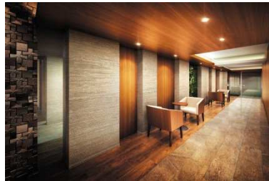
▲桜の邸エントランスホール完成予想図