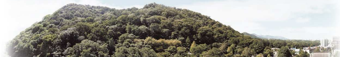
▲現地11階相当より西方面を望む