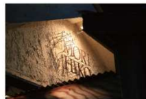
▲カフェ森彦 桜の邸: 徒歩4分、杜の邸: 徒歩4分。