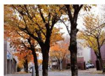
▲南4条通（秋） 桜の邸: 徒歩3分、杜の邸: 徒歩3分。