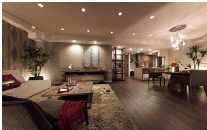
▲モデルルーム写真(M-Gタイプ)