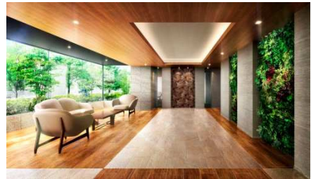
▲杜の邸エントランスホール完成予想図