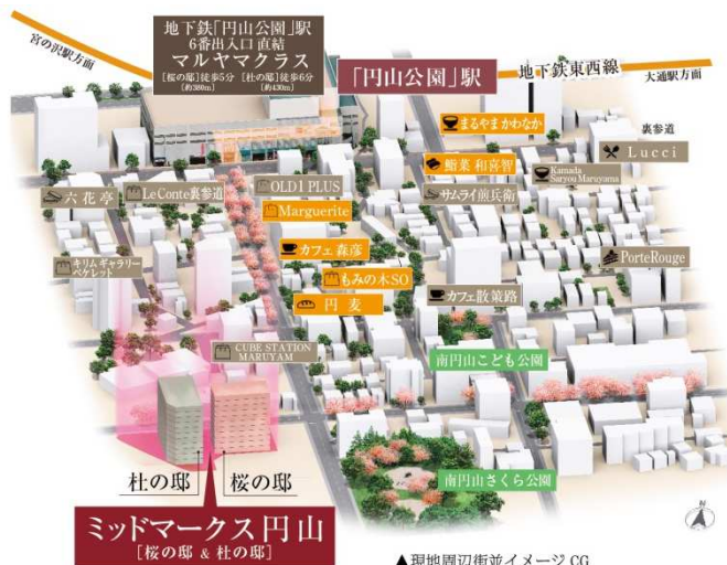
▲現地周辺街並イメージ CG