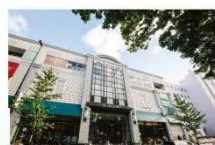
▲マルヤマクラス 桜の邸: 徒歩5分、杜の邸: 徒歩6分。