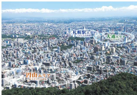
円山上空から北東方向の札幌都心を望む（平成25年8月撮影）