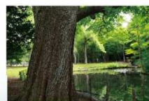
▲円山公園 桜の邸: 徒歩7分、杜の邸: 徒歩6分。