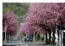
▲南4条通（春） 桜の邸: 徒歩3分、杜の邸: 徒歩3分。