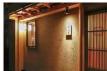
▲鮎菜 和喜智 桜の邸: 徒歩6分、杜の邸: 徒歩6分。