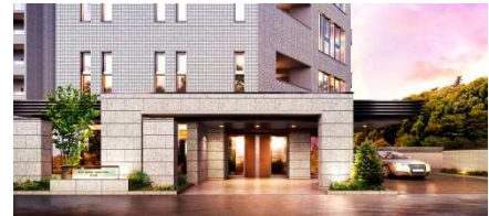
▲杜の邸エントランス完成予想図