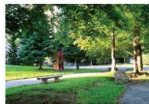
▲南円山さくら公園 桜の邸: 徒歩2分、杜の邸: 徒歩2分。