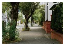
▲現地周辺の街並 桜の邸: 徒歩6分、杜の邸: 徒歩7分。