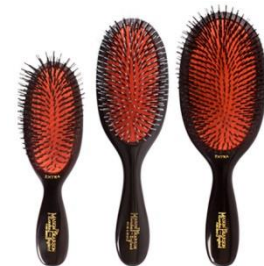
メイソンピアソン 国内唯一の正規販売代理店をつとめる、英国伝統のハンドメイドヘアブラシ