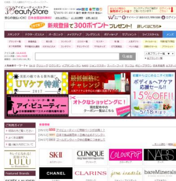
iBeautyStore 有名ブランドやレアものコスメまで幅広いラインナップの商品を販売