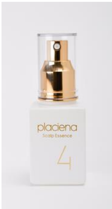
「プラシエナ スカルプエッセンス クアトロフォーミュラ」 定価 9,720 円(税込)

『プラシエナ』は、女性が安心してスカルプケアをしていただけるよう、開発したブランドです。近年、頭皮ケアや育毛促進を促す医療機関やクリニックで発毛や美肌治療として注目されている“プラセンタ ※2 ”を、ご家庭でのスカルプケアで手軽に取り入れていただくことができます。