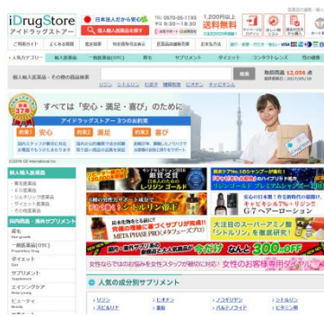
iDrugStore 世界の最新の治療薬と健康商品を販売