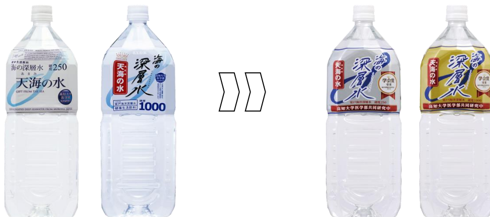
旧パッケージ(左:硬度 250、右:硬度 1000)

赤穂化成株式会社(本社:兵庫県赤穂市、代表取締役社長:池上良成)では、長年培った海洋科学技術を生かし、製造している健康飲料「海の深層水 天海の水(硬度 250、1000)」の2Lと500mlのパッケージを2017年6月1日(木)出荷分より順次リニューアルいたします。