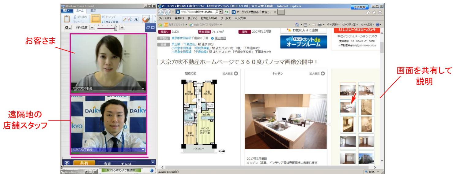
利用画面イメージ

「店舗間IT接客」ではIT重説にも対応した「MeetingPlaza」というソフトを使用し、インターネット回線を通じてお客さまと遠隔で対面接客（＝テレビ電話）を行います。