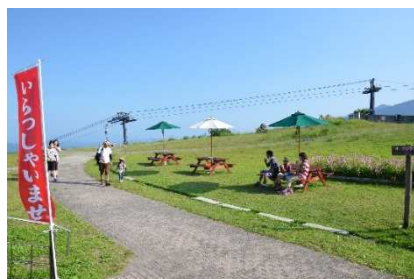
うさぎ平テラス (白馬八方尾根)

また、2016年12月に新設した「天空の CORONA ESCAPE TERRACE (コロナ エスケープテラス)」はグリーンシーズンも継続オープンします。オープン以降連日、国内外からのお客様でにぎわい、多い日には一日 500 名、ウィンターシーズン全体で 1 万人近くのお客様にご利用いただきました。コロナビールと心を解放するパノラマ絶景をお楽しみいただけます。さらに今シーズンは、夏休み期間とお盆時期の特定日にライブミュージックイベントを開催します。ソファでゆったりしながら、絶景とコロナビールを音楽と一緒に楽しむ、山岳リゾートならではの時間を満喫できます。