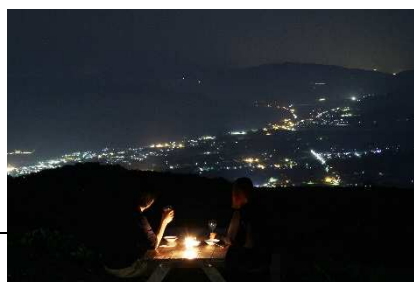
ナイトイベント (白馬岩岳)