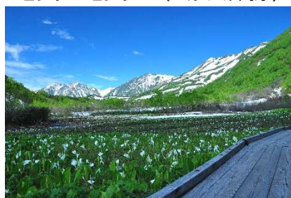
白馬三山と水芭蕉 (つがいけ高原)