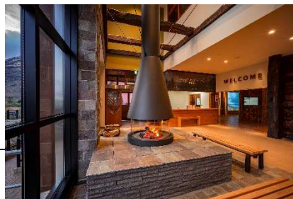
ビジターセンター (つがいけ高原)

本州で一番遅咲きの「水芭蕉」の群生が見ることができる梅池自然園。雄大な白馬三山を望みながら咲き誇る水芭蕉は圧巻です。長野県でしか見られないこの貴重な光景を未来へ残すため、夏休み期間中 (7月15日～8月31日) に「長野県の子供なら一度は行ったことのある場所。梅池自然園」を開催します。長野県の小学生ならゴンドラリフト乗車賃と梅池自然園入園料が無料となります。また、参加型謎解きイベント「トレジャーハンティング」(小学生以下限定)も開催しており、ファミリーにお勧めのお出かけスポットです。