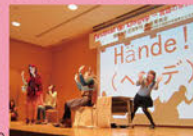
外国語学部国際文化交流学「言語の祭典」より

「外国語劇赤ずきん」(英語・ドイツ語・中国語) 6月11日(日) 14:30-15:30 3号館305 神奈川大学外国語学部