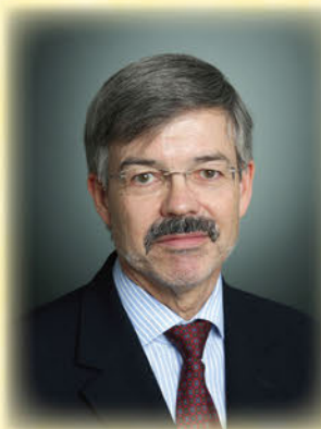
※日独逐次通訳あり