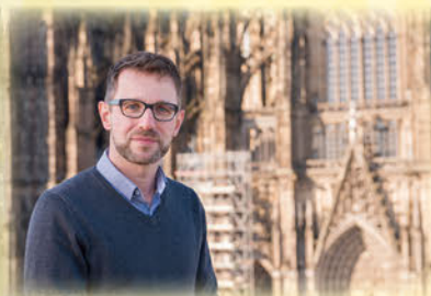
※日独逐次通訳あり