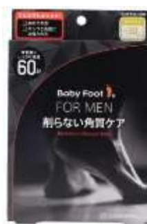
ベビーフット イージーパック DP60(メンズ)