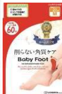
ベビーフット イージーパック DP60