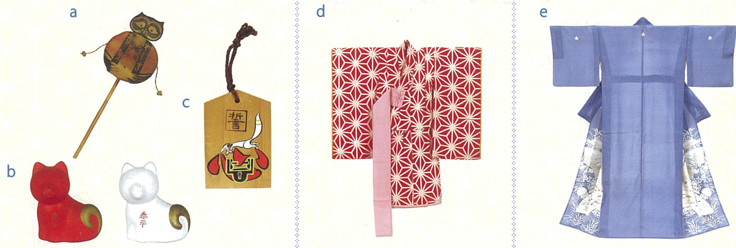
a.「でんでん太鼓」香川県屋島 b.「白犬・赤犬」愛知県知立市知立神社 c.「絵馬(心に錠)」 d.「麻の葉模様一つ身」大正9～10年頃 e.「薄藤紵地扇面秋草模様留袖」昭和7年 すべて東京家政大学博物館蔵

本展では、魔や穢れを祓うために人々が生み出した考えや風習の中から、今でも目にする行事、物や模様を中心に紹介します。