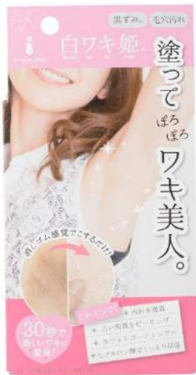
白ワキ姫 商品画像

◆白ワキ姫 E Cサイト： https://nonplex.jp/item/296