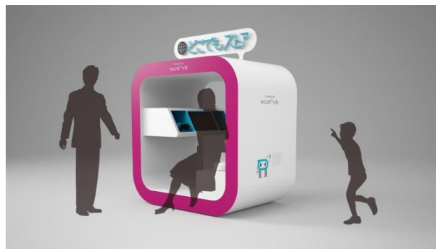
VR遠隔接客店舗「どこでもストア」イメージ図

大京穴吹不動産は、今後ともIT接客拠点の拡大・サービス内容を拡充し、より満足度の高いサービスを提供してまいります。