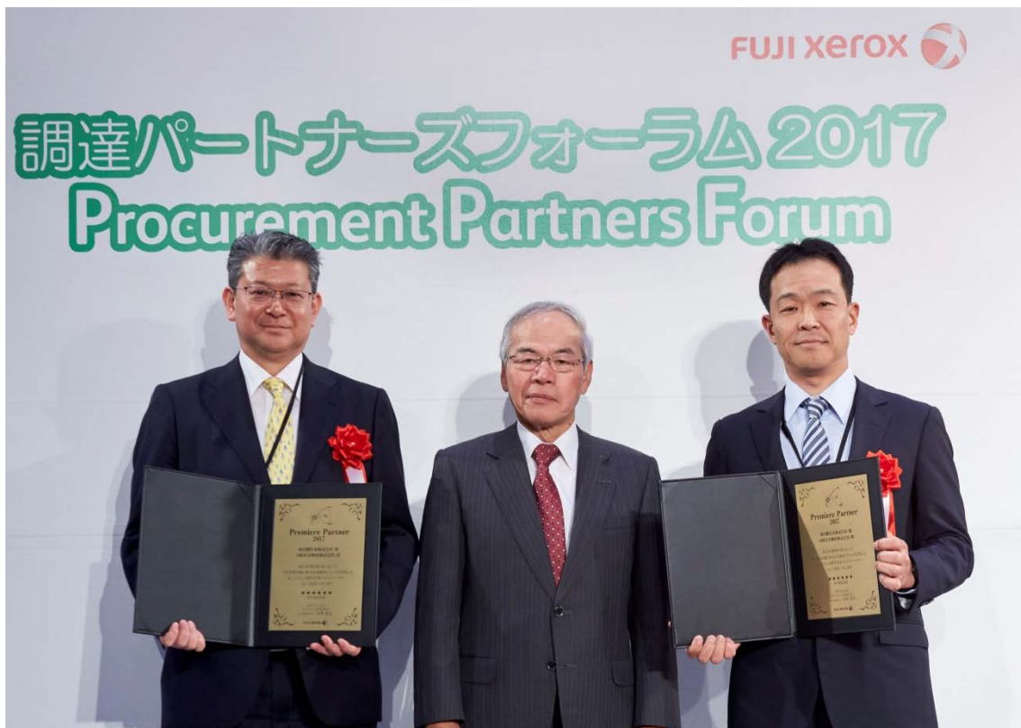
パートナーズフォーラムの様子

新日鐵住金は富士ゼロックス社へ環境対応型低炭素鉛フリー快削鋼（*後述）や表面処理鋼板を納入しており、技術・品質面のみならず、安定供給力や環境経営におけるマネジメント姿勢項目においても高い評価を頂きました。