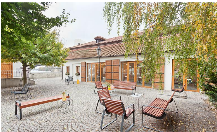
CIHELNA CONCEPT STORE