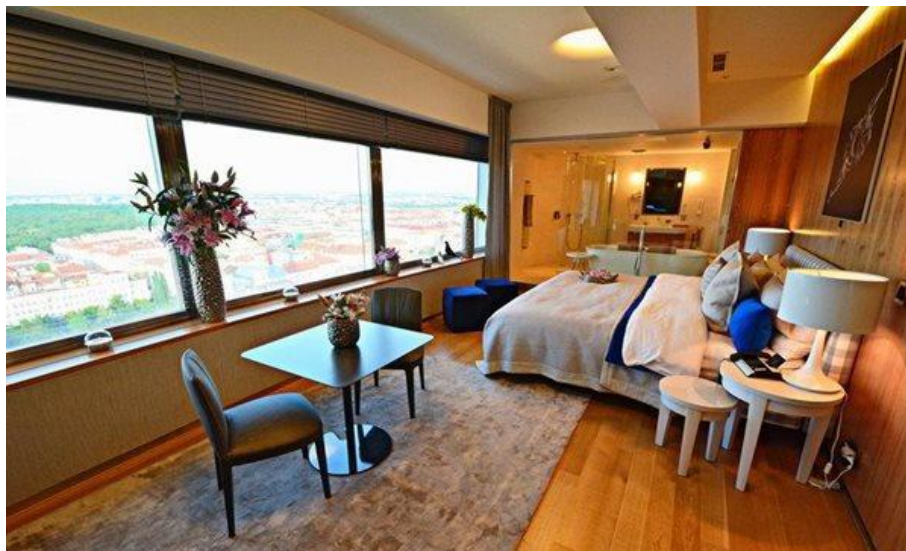
One Room Hotel