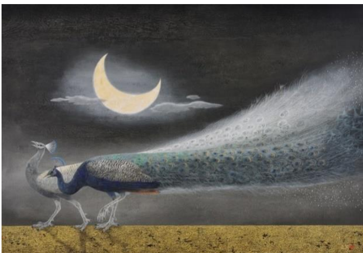
西田 俊英「月と孔雀」2017年 岩絵具・和紙