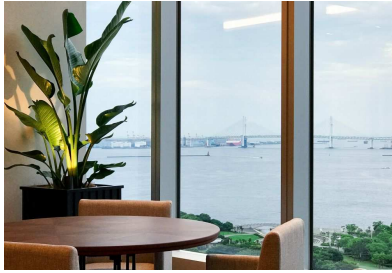
大きな窓からレインボーブリッジが一望できる

リゾートファッションでご来店のお客様対象“ランチタイム割引キャンペーン”を実施 2017年8月1日（木）～9月30日（土）