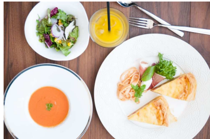
「キッシュランチ」1,200円(税込)