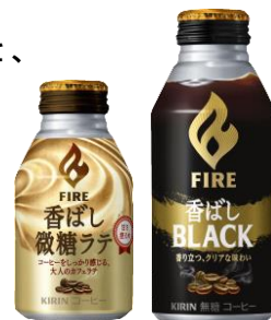
左から：「ファイア 香ばし微糖ラテ」、「ファイア 香ばしブラック」

＜パッケージ＞堂々とした炎ロゴで「ファイア」の自信やこだわりを、躍動感のある金の帯やコーヒー豆で、香ばしい香りが感じられる味わいを表現しました。