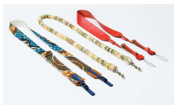
カメラストラップ各種 2,730円～