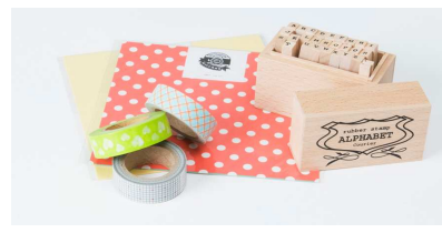
スタンプ、マスキングテープ 120円～