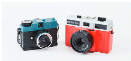
左【ロモグラフィー】ダイアナ・ミニ 5,980円