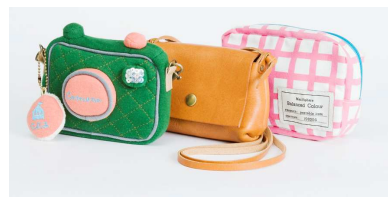
カメラポーチ&ケース各種