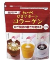
ひざサポートコラーゲン