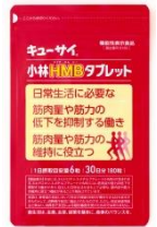
小林 HMB タブレット

「健康と幸せ」を世の中に提供し持続可能な社会に貢献すること それがキューサイの使命です。