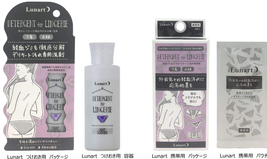
Lunart つけおき用 パッケージ

■ルナート ECサイト： http://nonplex.jp/item/2670