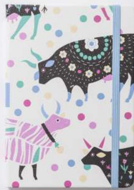
HAPPY COW (2941)