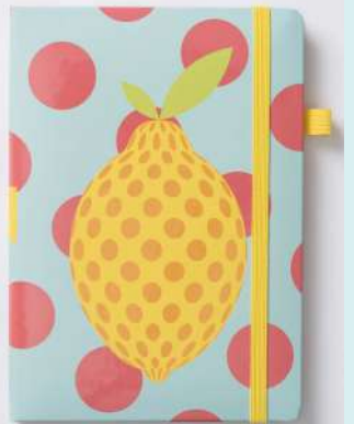
LEMON DROP (2948)