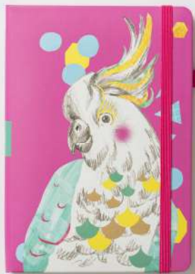
DANCING BIRD (2946)

鮮やかな色の組み合わせにキュートなモ チーフ。持ち運べる身近なアートとして、ち よっぴり誇らしい気持ちにさせてくれます。 一息つくときにじっと見つめたい、あな たの自慢の 1 冊に。