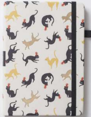
PARTY CAT (2944)