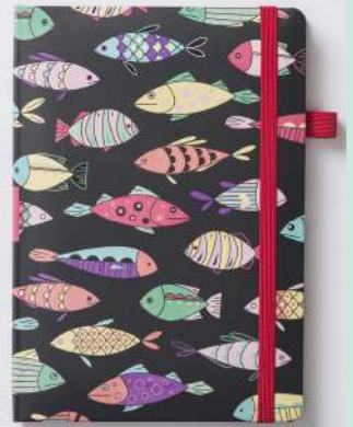
NIGHT SEA (2942)