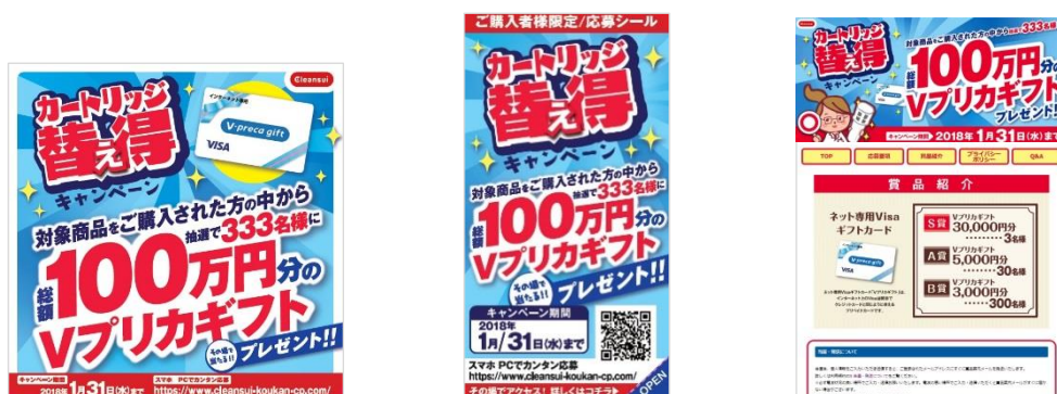
「カートリッジ替え得キャンペーン」 キャンペーンPOP(左)と、キャンペーンシール(中)、キャンペーンサイト(右)