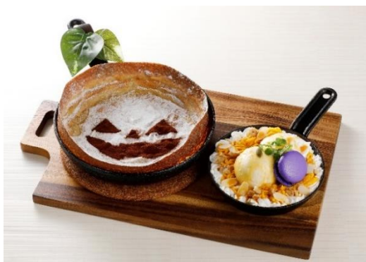
『パンネクック ハロウィンパンプキン』

焼き立てのパンネクックに、天然海塩でほんのり塩味を効かせたカボチャペーストとマスカルポーネの特製ホイップをトッピングしてお楽しみいただけます。クルミ、アーモンドなどのナッツもアクセントとして添えています。