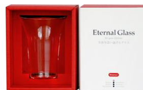
MIZUグラス (名入れサービス実施中)