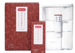
「和食のためのクリンスイ」 シリーズ