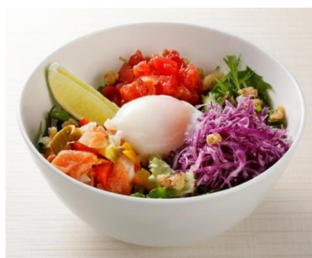
『新米のグレインズサラダ』

カボチャクリームを使用したパティシエ特製の紫色のマカロンも添え、ハロウィンらしさを感じるスイーツメニューに仕上げました。