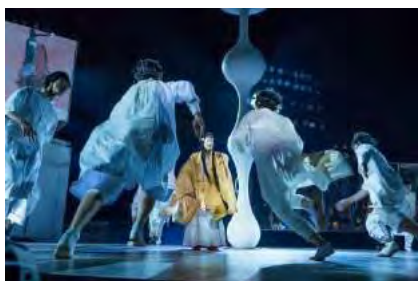
東京キャラバン～プロローグ～（2015年）

詳細は、公式Webサイト（ http://tokyocaravan.jp/ ）にてご覧いただけます。