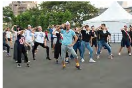
東京キャラバン in 八王子（2017年）

東京都及びアーツカウンシル東京（公益財団法人東京都歴史文化財団）は、「東京キャラバン in 熊本」を熊本県、熊本市、公益財団法人熊本県立劇場、熊本市現代美術館（公益財団法人熊本市美術文化振興財団）とともに開催します。「東京キャラバン」では、参加者も大切なアーティストと考えています。集結したアーティストと参加者が、一緒に新しいパフォーマンスが生まれる瞬間を体験することで、日本が文化の力でひとつになる大きなムーブメントとなり、東京2020オリンピック・パラリンピックと、その先の未来へと続いていくことを願っています。