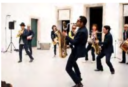
東京キャラバンin RIO（2016年）