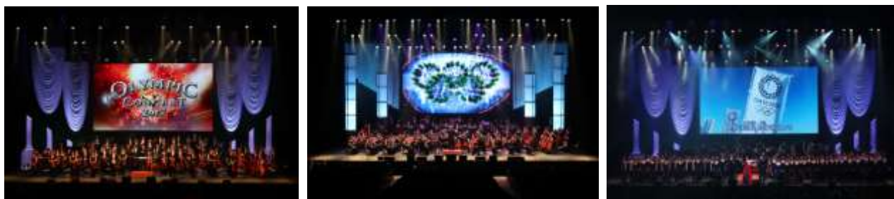
写真:オリンピックコンサート2016/2017より