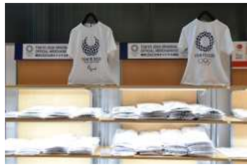
昨年度の様子（東京 2020 公式ライセンス商品販売コーナー）