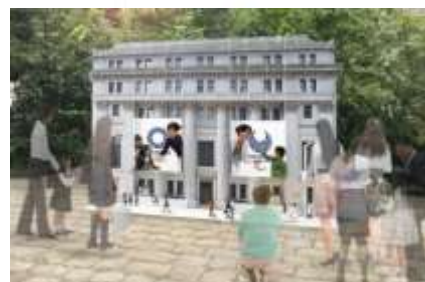
「日本橋シティドレッシング フォトセット」