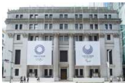
三井本館中央通り沿い壁面装飾

なお、本イベント期間中には、東京2020組織委員会が、日本橋三井タワー1階で期間限定の「東京2020公式ライセンス商品販売コーナー」をオープンします。