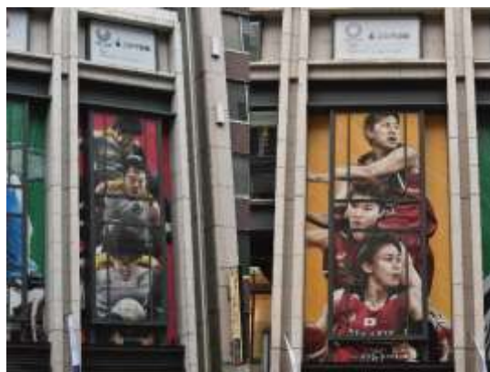
昨年度の様子（COREDO 室町 1・3 中央通り沿い壁面装飾）