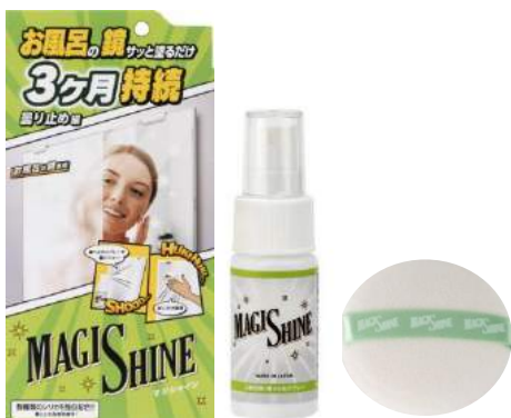
「マジシャイン お風呂鏡の曇り止めスプレー」商品画像

■「マジシャイン お風呂鏡の曇り止めスプレー」ECサイト： http://nonplex.jp/item/2726