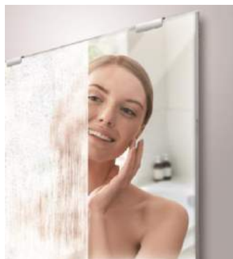
使用前と使用後のイメージ画像

入浴時、何度シャワーで洗い流してもすぐに曇って見えなくなってしまうお風呂の鏡。クレンジングや髭剃りをしたくても曇った鏡では何も見えず、困っている方も多いのでは。