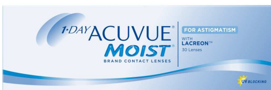
「ワンデー アキュビュー モイスト」乱視用