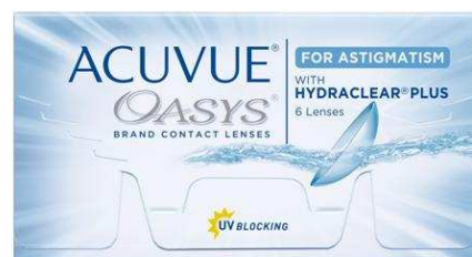
「アキュビュー オアシス」乱視用