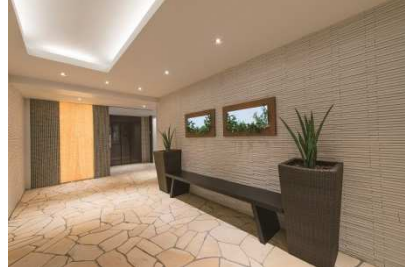
エントランスホール ・エントランスホール壁面には無機ELパネルを使用したグリーンアートを設置 ・エントランスベンチ、植栽設置