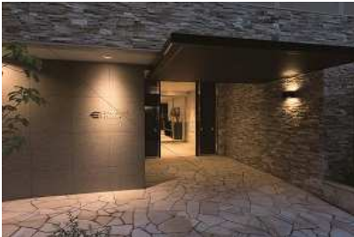
エントランス 床はアプローチから連続した自然をイメージした割肌石