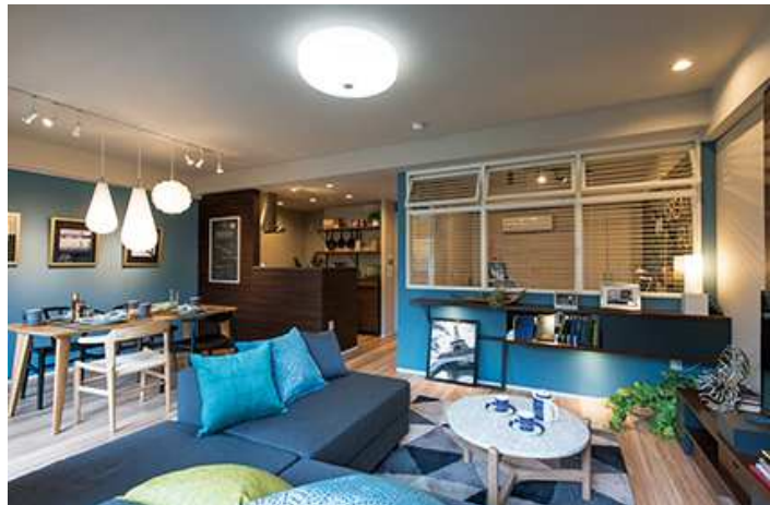
リビング・ダイニング

当社グループは、「足りないモノ」を「余るモノ」で再生する不動産ソリューションを通じて、社会的な課題の解決を図るべく、昨年10月に中期経営計画「Make NEW VALUE 2021 ～不動産ソリューションによる 新・価値創造～」を策定し、「ストック型社会*の実現に向け、不動産ソリューションで新たな価値を創造し、次世代に継承される社会の資産を蓄積する」ことを目指しております。大京穴吹不動産では、業界トップクラスの販売戸数を誇るリノベーションマンション「Renoα（リノアルファ）」、今年新規に事業参入したリノベーション戸建「Reno Terrace（リノテラス）」と合わせ、2021年3月期にはリノベーション住宅販売戸数を2,500戸超の規模に拡大してまいります。