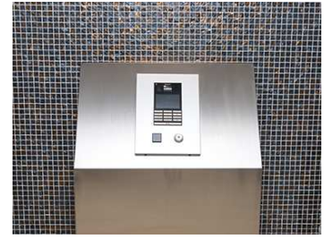
オートロック操作盤