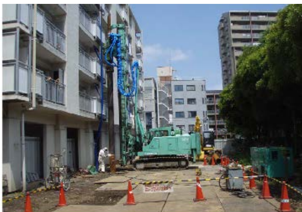
写真3 集合住宅耐震補強の狭隘地施工