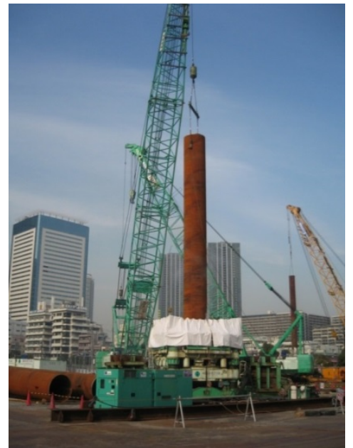
写真4 軟弱地盤上の高層マンションでの大深度施工