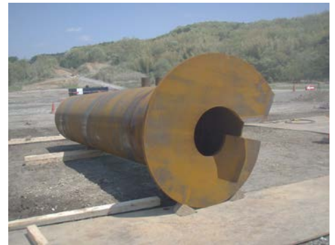
写真1 NSエコパイル外観

土木分野 (鉄道・道路施設、送電鉄塔等)、 建築分野 (公共施設、マンション・事務所ビル、工場設備等) で全国多数実績有り