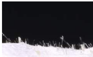
使用後無数の産毛が取れた様子