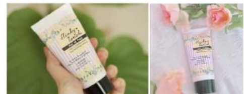
実際に SNS で投稿されている画像

特に10代~20代の女性はサロンよりも手軽で低価格な商品を探しているのではないかと考え、「スリンキータッチ」シリーズは若い女性をターゲットに絞っています。産毛ケア類似品の中でも、低価格帯で、置いているだけでも“かわいい”インスタ映えになるパッケージを採用。「スリンキータッチ」シリーズのターゲット層は、SNSを活発に使用する世代であるため、一気に拡散されました。