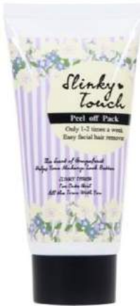
「スリンキータッチ 産毛ピールオフパック」

・スリンキータッチ 産毛ピールオフパック EC サイト： http://nonplex.jp/item/1576