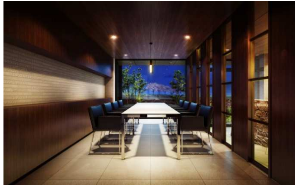
ミーティングルーム