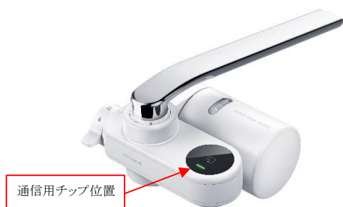
通信用チップ位置

クリンスイCSP801をベースに スマートフォンと通信するチップを内蔵 《クリンスイ CSP801i》