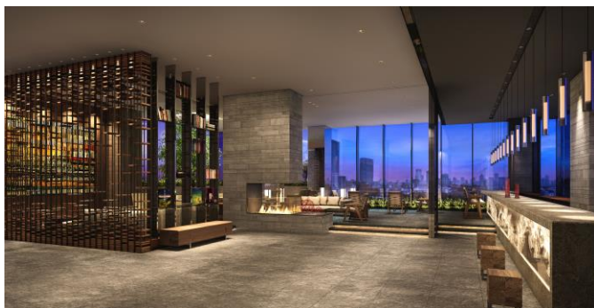
スカイロビー（イメージCG）