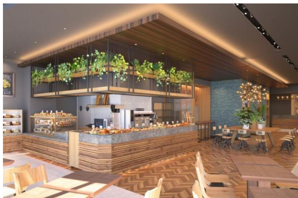
ベーカリーカフェ・レストラン（イメージCG）