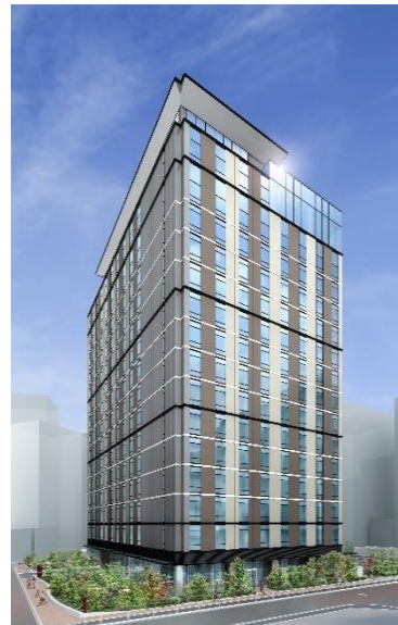
三井ガーデンホテル五反田 (完成予想パース)