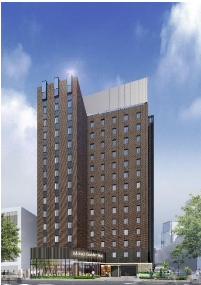
三井ガーデンホテル大手町 (完成予想パース)

現在、三井ガーデンホテルズは、日本全国で20施設・5,337室を運営しておりますが、両2ホテルの開業により、22施設・5,898室となる予定です。今後も大都市圏や地方政令指定都市を中心に積極的に新規展開を行うとともに、ワンランク上の宿泊主体型ホテルとして「お客様の五感を満たすホテル」、「記憶に残るホテル」を目指し、ホスピタリティ溢れるサービスの提供に努めてまいります。