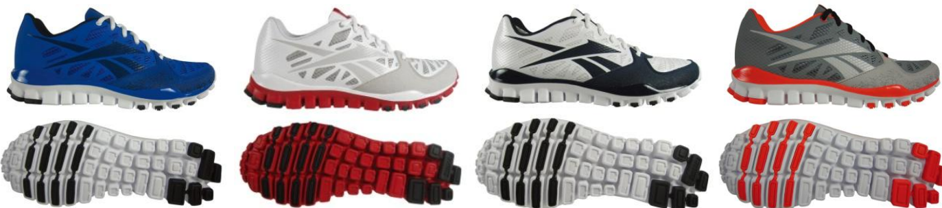
バイタルブルー/ホワイト/ ブラッククラブブルー

「REALFLEX」を搭載したトレーニングユースモデル。最新テクノロジー“HOT MELT(ホットメルト)”を採用。熱融着技術により、通気性は妨げずに、部位に応じてホールド感を向上させます。激しいトレーニングにも対応するべくソールには耐久摩擦素材を使用。