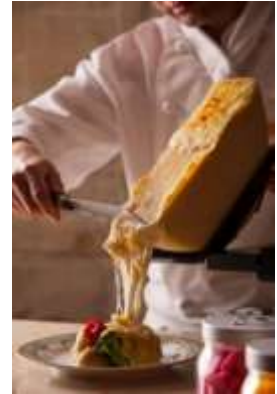
桜ディナーブッフェ『ラクレットチーズ』

毎年ご好評いただいている「桜ブッフェ」に、大人気の北海道産ラクレットチーズを使った料理が登場。ランチでは、とろーりとろけるラクレットチーズソースを季節野菜やバゲットとご一緒に。特製フルーツビネガードレッシングで味わう季節野菜のサラダや塩麹でマリネしたビーフソテー、桜の葉を練り込んだ桜葉そばなど、春の到来を感じる目にも華やかな料理やスイーツをご堪能いただけます。ディナーでは、芳香な香りの北海道十勝産ラクレットチーズと人気のにぎり寿司を目の前で仕上げご提供。サーロインステーキやホテル伝統の米茄子鳴炊きのほか、厳選された春爛漫のメニューとともに贅沢な美味を心ゆくまでどうぞ。お食事の前後にはぜひ庭園の桜鑑賞をお楽しみください。