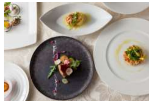
右上：桜ランチbuffet『ラクレットチーズソース』 右下：イル・テアトロ『Il ciliegio giapponese～桜～』