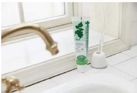
デンティス商品画像