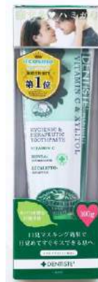
デンティス チューブタイプ パッケージ画像