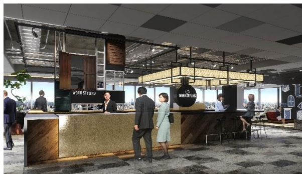
全国約 30 拠点展開。10 分単位で利用可能な 従量課金制シェアオフィスサービス