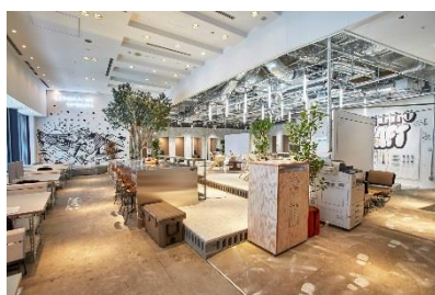
ワークスタイリング汐留