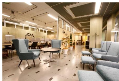
ワークスタイリング新宿西口