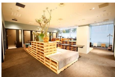
ワークスタイリング大崎