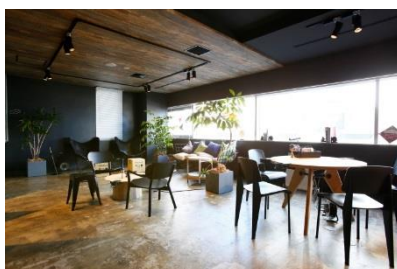
ワークスタイリング渋谷