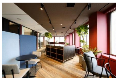
ワークスタイリング霞が関

当社はビルディング事業において、「その先の、オフィスへ」というステートメントを掲げております。既成のオフィスビルの概念を超えて、新たな付加価値を生み出すことを目指し『三井のオフィス』に集うお客様が、単に「働く」だけでなく、様々な On Time/Off Time を過ごし、集う、そんな”新しい生活”の場を提供してまいります。