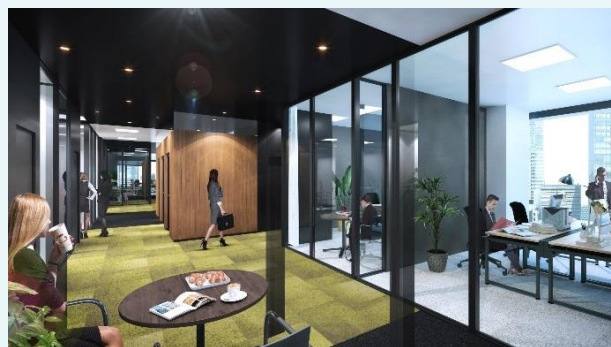
1日～、1席～、フレキシブルに選べるオフィスサービス