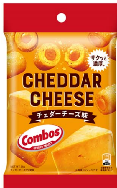
コンボス® クラッカー チェダーチーズ味