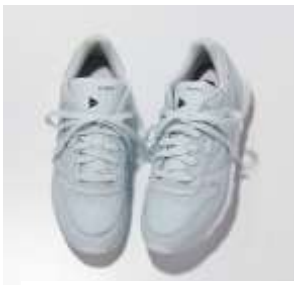
ちょっとクラシカルに