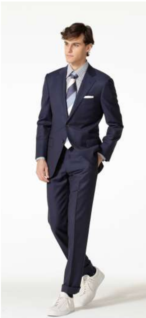
スーツはストレッチ性と軽さが特徴。レザーシューズでドレスシーに。