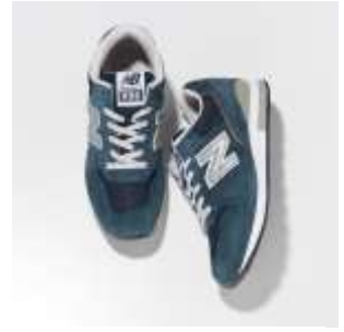
軽く快適なクッション性