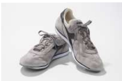
ヴィンテージライクが新しいレザースニーカー