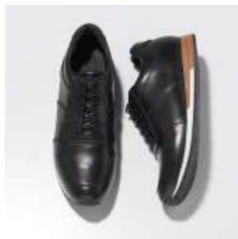
フランスを代表するシューズブランド