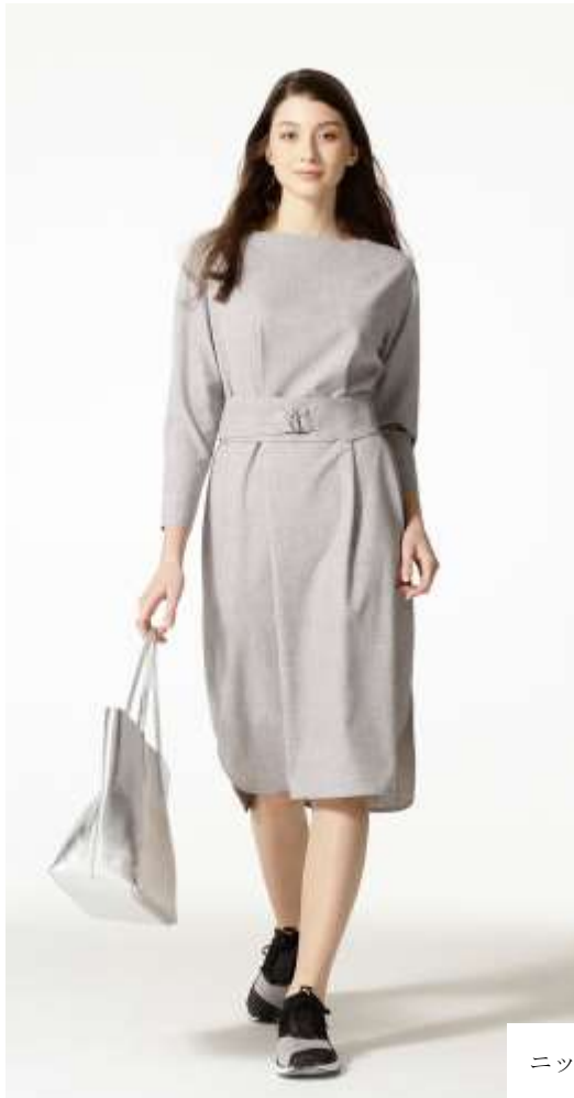
ニットのシューズで軽やかに