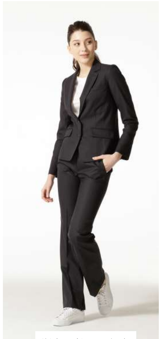
長め丈にはボリュームのある白