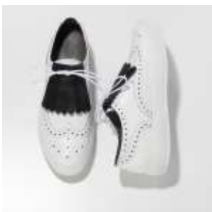
ウィングチップのリュクスな白