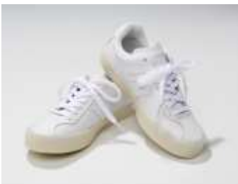
春夏に映えるシンプルデザイン