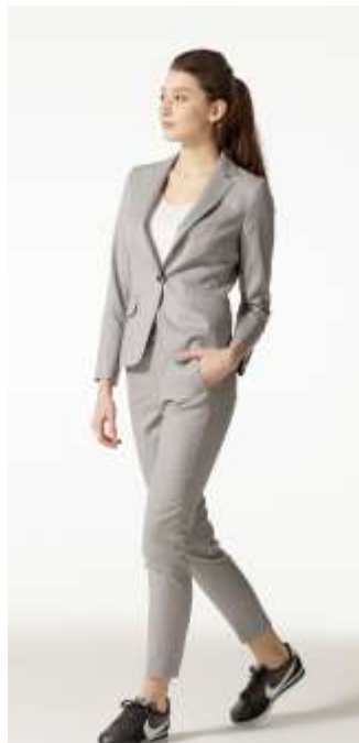
アンクル丈にはスリムな黒で