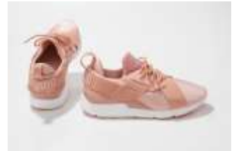
サテン素材がフェミニン