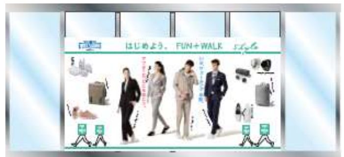
2階ウエルカムゾーン