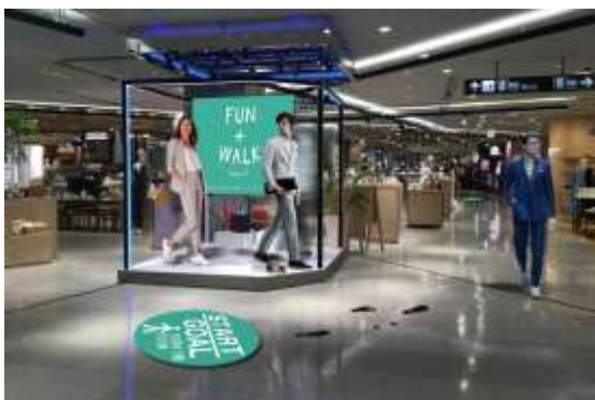
8階ウエルビーフィールド