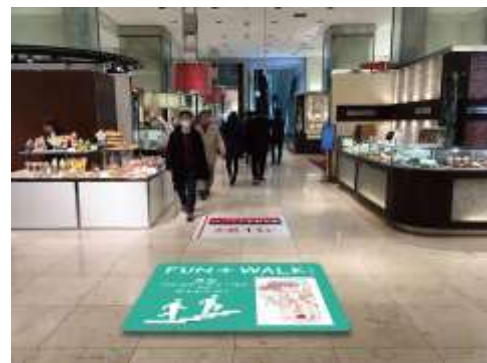
2階JRロエントランス