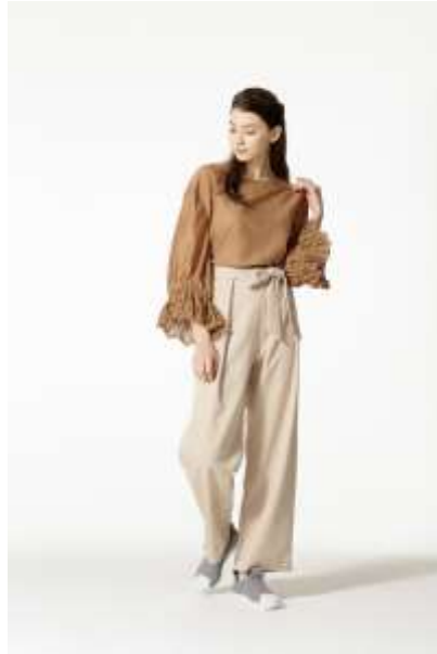
ワイドパンツにグレーを効かせて