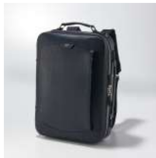
上質なレザー使用の3WAY バッグ