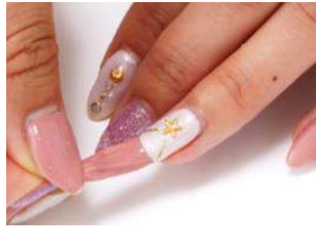
オフ時イメージ写真