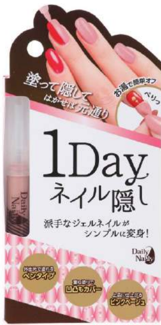
商品パッケージ写真