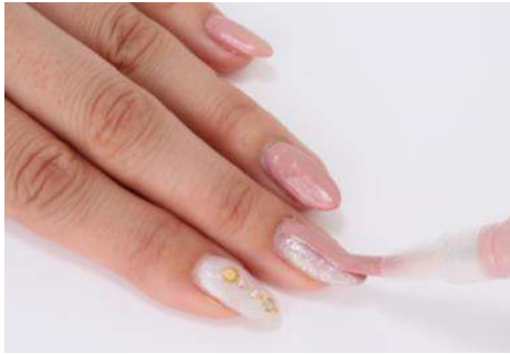
使用時イメージ写真