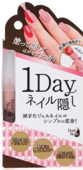
商品パッケージ写真

■「DAILY NAILLY 1Day ネイル隠し」EC サイト： https://fan.liberta.net/item/nonplex/7631/